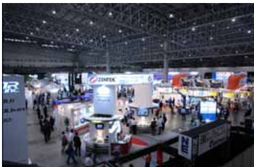
CEATECには5日間で約20万人が来場。

CEATEC出展は、当社がカーエレクトロニクスの総合商社である事に加え、技術商社としての存在を、産業界及びエンドユーザーに示す絶好の場となりました。当社は今後も各種展示会に積極的に出展していく所存です。